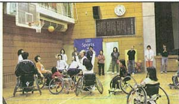
いろいろなスポーツの体験会Sports of Heartを開催