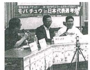
元代表監督の岡田武史氏が参加したワールドカップ・トークをモバチュウ