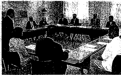
◀ 設立会議 ▶

中継本部に試合の映像と音声を送る。中継本部からサイバーに配信してパソコンのホームページで閲覧できる。遠隔地のようにし、遠隔地などの応援者らに試合の様子を伝える。試合中継のほかにも、FOMAを使った選手